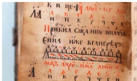
Рисунок 7 – Художественное оформление рукописи «Устав о христианском житии», середина XIX в. П19–20/Нр43

Примечателен переплет: доски покрыты коричневой кожей с тиснением, покрытие загрязнено (возможно, было окрашено или покрыто лаком). В центре обеих крышек закреплены металлические медальоны с чеканом. На верхнем медальоне изображен Иоанн Креститель (?), на нижнем – эмблема «Распятие». Застежка «в зацеп»: потемневший от