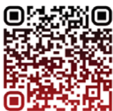
Электронный каталог ЦНБ НАН Беларуси

2 октября в Российской государственной библиотеке (г. Москва) состоялся Российско-Белорусский круглый стол «Наука и библиотеки в годы Великой Отечественной войны». Это совместное научное мероприятие, во время проведения которого было подписано соглашение о сотрудничестве между ЦНБ НАН Беларуси и Российской государственной библиотекой, предполагающее партнерство между сторонами в библиотечно-информационной, научной и социокультурной деятельности.