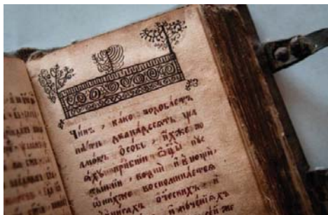
Рисунок 6 – Сборник старообрядческий, вторая половина XIX в. П19–20/Нр11

Книга «Устав о христианском житии» входит в состав рукописного сборника П19–20/Нр11 , купленного у М. С. Севастьянова в 1991 г. Рукопись выполнена полууставом одного почерка на бумаге машинного производства и включает также текст книги «Сын церковный» 7 . Помимо этого, в начале сборника помещены тексты: «О правиле утреннем и о вечернем в дому своем» (Молитвенное правило) и «Чин како подобает пети двенадесать псалмов» (Чин чтения 12 псалмов).