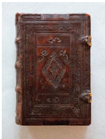
Рисунок 4 – Устав о христианском житии, [вторая половина XIX в.]. K19–20/Нр46