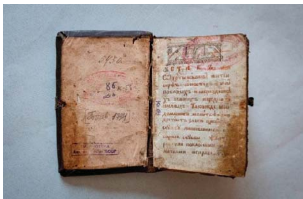
Рисунок 1 – Устав о христианском житии. – [Клинцы, после 1795]. K16-18/Hp11

Самый ранний печатный экземпляр K16–18/Hp11 поступил в фонд академической библиотеки из Государственной библиотеки СССР им. В.И. Ленина в 1965 г. Издание вышло в 8° на бумаге ручного производства с сеткой. Экземпляр неполный, имеются утраты, восполненные рукописными вставками на голубой бумаге ручного производства: 4 листа в начале книги, 3 – в конце.