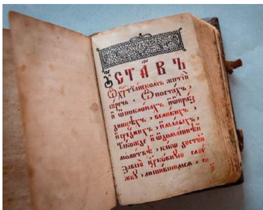
Рисунок 5 – Рукопись «Устав о христианском житии», середина XIX в. K19–20/Hp2

Текст и оформление рукописной книги близки к уже рассмотренному нами выше «Уставу о христианском житии», напечатанному в Клинцах в типографии Фёдора Карташева, после 1795 г., возможно, именно это издание (либо одно из близких ему изданий) положено в основу рукописи.