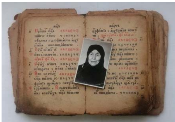
Рисунок 2 – Устав о христианском житии. – [Дергачи: типография Л. Гребнева, конец XIX – начало XX в.]. K19–20/Hp38

«Устав о христианском житии» K19–20/Hp23, предположительно, был издан в 1908 г. Утрачены листы в начале и конце блока, последний из сохранившихся (л. 253) содержит начало Пасхалии, рассчитанной с 7416 [1908] г.