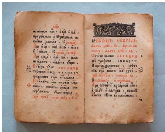
Рисунок 3 – Устав о христианском житии, [1908]. K19–20/Hp23

В книге не менее 44 заставок с 18 досок, большая часть которых, как и в предыдущем издании, отображена в альбоме орнаментики Л. Гребнева, что, как уже было сказано выше, не является определяющим признаком для корректной атрибуции.