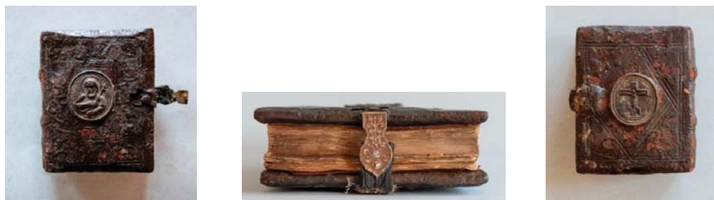
Рисунок 8 – Переплет рукописи «Устав о христианском житии», середина XIX в. П19–20/Нр43

времени пробой, ремень из черной кожи с фигурной пряжкой желтого металла, украшенной растительным орнаментом.