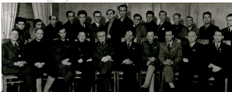
Участники сессии АН БССР. 12 марта 1942 г.