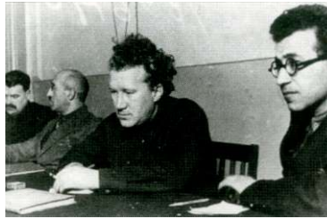
Сотрудники БелАН во время декадника Академии в Москве. 1933 г.