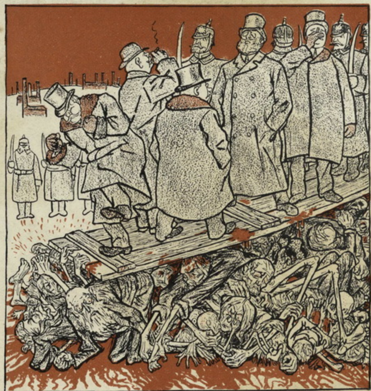
Рис. Т. Т. Гейне.

Вышли въ свѣтъ двѣ серіи открытыхъ писемъ: красочная (23 сюжета) и однотонная (20 сюжетовъ). Готовится и въ скоромъ времени выйдетъ изъ печати третья серія. Стоимость открытыхъ писемъ въ розничной продажѣ: красочн. — 10 коп., однотон. — 8 коп. Торговцамъ и оптовщикамъ дѣлается обычная скидка. Со склада открытыя письма продаются въ количествѣ не менѣе 200 штукъ. На комиссію изданія не отпускаются.