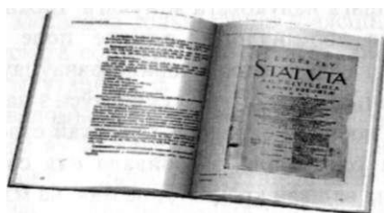
Издания, подготовленные ЦНБ НАН Беларуси