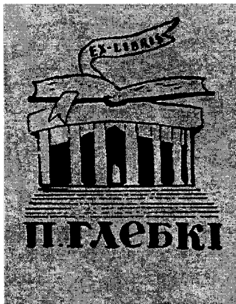
Экслібрыс П. Глебкі работы М. Тарасікава. Пяро, туш. Канец 1950-х – першая палова 1960-х гадоў

адмовіўся і ад таго, і ад іншага, спыніўшыся на максімальна лаканічным варыянце.