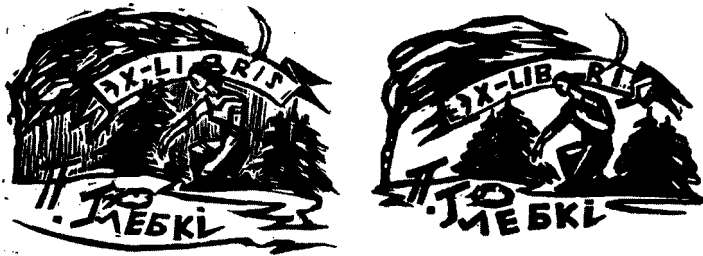
Экслібрыс П. Глебкі работы Я. Красоўскага. Лінагравюра. 1966 г.

ён экспанаваўся, – Другая выстаўка беларускага кніжнага знака, што прайшла ў Мінску ў 1968 г. А ў 1971 г. гэты кніжны знак маглі назіраць наведвальнікі экспазіцыі «Літаратурныя матывы ў экслібрысе», арганізаванай у бібліятэцы АН БССР.