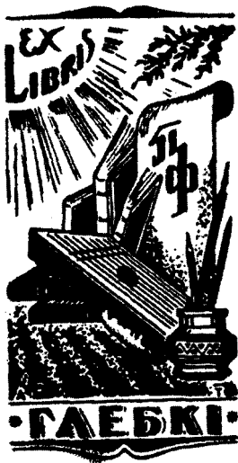
Экслібрыс П. Глебкі работы А. Тычыны. Цынкаграфія. 1960 г.

Класічны твор А. Тычыны вядомы, бадай, кожнаму айчыннаму аматару кніжнага знака. Ён неаднаразова экспанаваўся на разнастайных выстаўках у Беларусі і за яе межамі, звесткі пра яго ўключаны ў многія выданні. Яго выяву можна ўбачыць і ў кнізе «Беларускі кніжны знак» (1975), складзенай А. Тычынам і В. Шматавым (гэта лепшая праца, прысвечаная беларускаму экслібрысу), і ў ілюстраваным дадатку да артыкула «Экслібрыс» у «Энцыклапедыі літаратуры і мастацтва Беларусі».