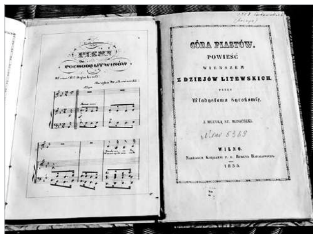
«Паходная песня ліцвінаў» С. Манюшкі (з нотамі), змешчаная ў аповесці У. Сыракомлі «Дачка Пястаў».

Падчас жыцця ў Вільні, а потым у Варшаве, кампазітар часта прыязджаў у Мінск, каб пагасцяваць у свайго сябра Дуніна-Марцінкевіча, пабачыць бацьку і сваякоў. Асабліва памятны быў для Манюшкі прыезд у 1856 г. калі тут праходзілі шляхецкія выбары. У гонар кампазітара адбылася вечарына, на якой прысутнічалі артысты і літаратары. У адну з паездак Манюшка пабываў у Каралішчавічах, непадалёк ад Мінска. Потым ён з захапленнем пісаў пра гэтае падарожжа. Апошні раз завітаў у Мінск у 1864 г., калі быў ужо вядомым і прызнаным кампазітарам.